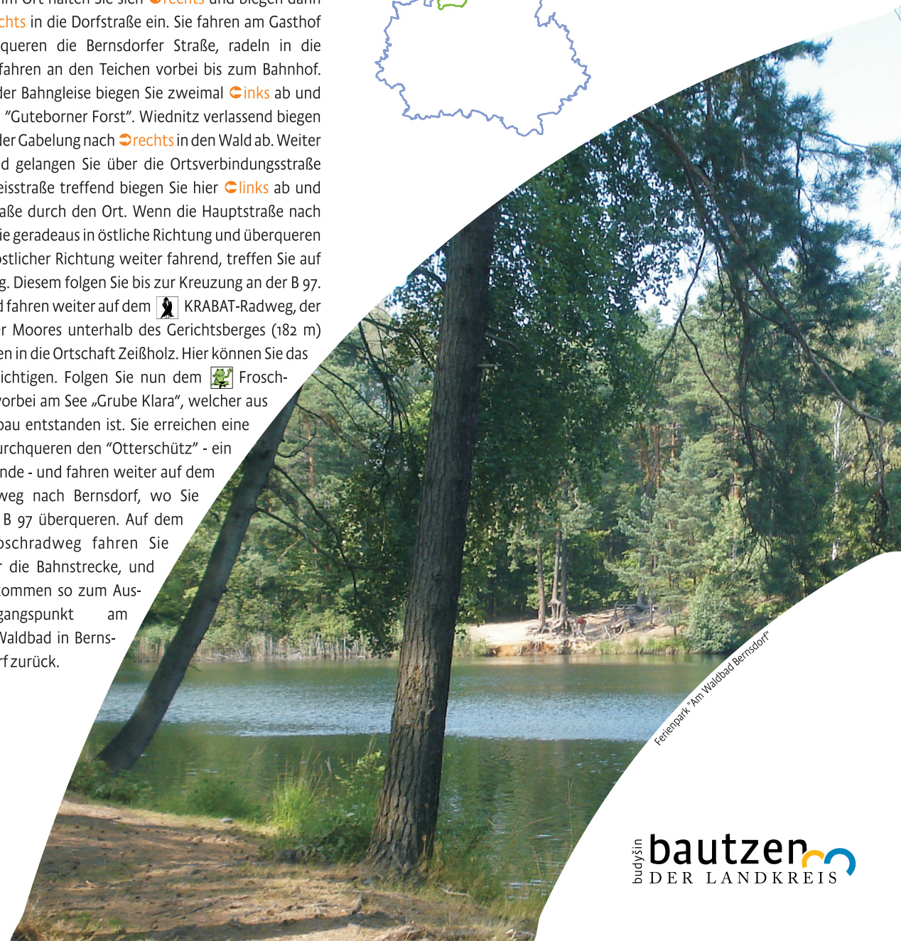
Ferienpark* Am Waldbad Bernsdorf

Herausgeber (Dezember 2020) Landratsamt Bautzen Kreisentwicklungsamt Macherstraße 55 01917 Kamenz Tel.: 03591 5251 61001 www.landkreis-bautzen.de