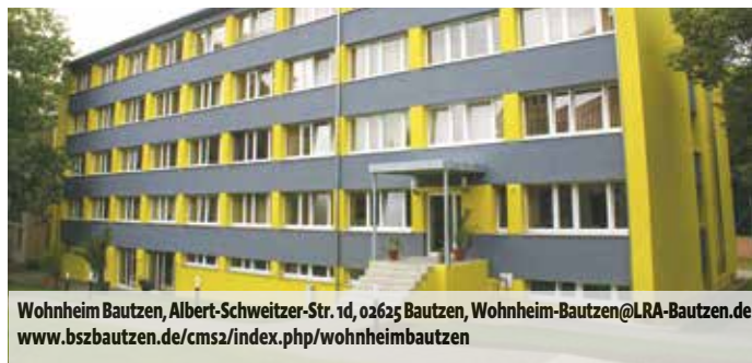
Wohnheim Bautzen, Albert-Schweitzer-Str. 1d, 02625 Bautzen, Wohnheim-Bautzen@LRA-Bautzen.de , www.bszbautzen.de/cms/index.php/wohnheimbautzen