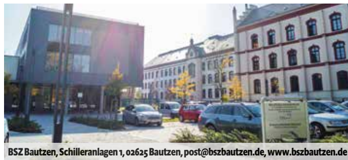
BSZ Bautzen, Schilleranlagen 1, 02625 Bautzen, post@bszbautzen.de , www.bszbautzen.de

Nach wie vor ist es Ziel der Schulleitung und des Landkreises als Schulträger, allen Schülern eine zuverlässige, qualitativ überzeugende berufliche Ausbildung zu bieten und damit in der Oberlausitz für die Oberlausitz die Fachkräfte