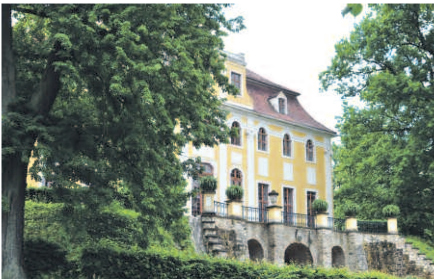
Ca. 50 Gäste kamen am 6. Juni anlässlich des Doppeljubiläums von Naturschutzstation (20 Jahre) und Vogelschutzwarte (15 Jahre) ins Neschwitzer Schloß. Nach einem kleinen Festakt nutzte man das schöne Wetter für einen informativen Rundgang durch den Park.