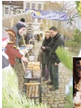
Für Groß die Leckereien, für Klein die Basteleien)

Schneemann-Grußkarten-Basteleien versuchen. Obendrein gilt die Eintrittskarte ins Schloss (für 1 €) auch noch als Gutschein für einen ordentlich durchwärmenden Glühwein oder Tee.