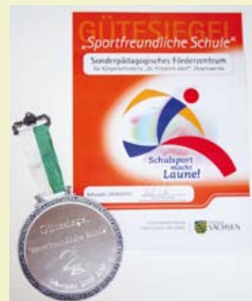
Im Landkreis Bautzen erhielt neben dem Ferdinand-Sauerbruch-Gymnasium Großröhrsdorf auch das Sonderpädagogisches Förderzentrum für Körperbehinderte „Dr. Friedrich Wolf“ in Hoyerswerda das Gütesiegel.