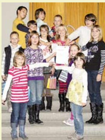
Die Radeberger Grundschüler zeigen stolz ihren Schülerpreis für Sächsische Heimatforschung