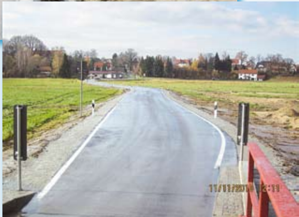
K 7254 nachher (11.11.2010)