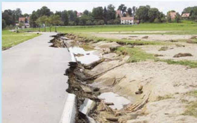
K 7254 vorher (10.08.2010)

So unterschiedlich die Ereignisse an diesem 11. November 2010 auch waren, eines haben doch alle gemeinsam: Der Tag wird in schönster Erinnerung bleiben!