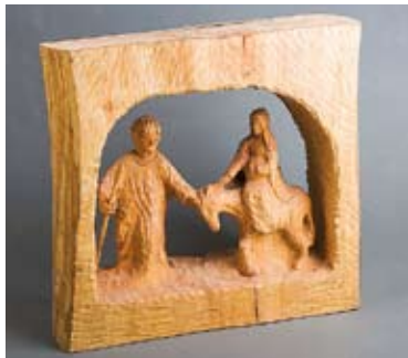
Bildunterschrift: Foto und Holzskulptur von Aloysius Scholze – Diese und weitere Schätze sind in der Weihnachtsausstellung zu bewundern

Märchenhafte Weihnachten verzaubern zum Hoyerswerdaer Weihnachtsmarkt am 11. und 12. Dezember das gesamte Schloss. Neben Leckereien die man rund um das Schloss und auf dem Schlosshof erhält, kann man märchenhaften Gestalten begegnen, die Weihnachtsausstellung besuchen und sich an den Weihnachtsgans-Auguste- und