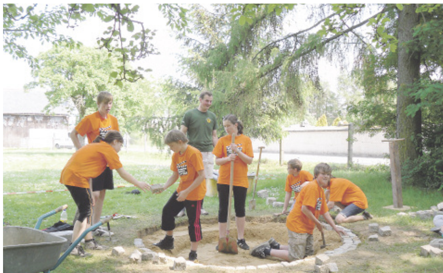
Die Jugendclubs Burkau (linkes Foto) und Eulowitz (rechtes Foto) zur 48-Stunden-Aktion 2011.