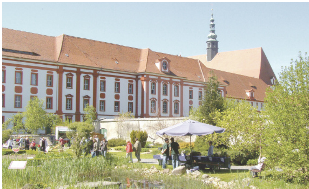
Am 29. April 2012 startet der Klostergarten von St. Marienstern Panschwitz-Kuckau in die Gartensaison 2012

Die ersten Zeichnungen unter dem Motto „Die Welt in deinen Augen“ sind bereits eingegangen. Wer sich noch am diesjährigen Mal- und Zeichenwettbewerb für Kinder bis 14 Jahre anlässlich des Kloster- und Familienfestes in Panschwitz-Kuckau beteiligen möchte, kann dies noch bis zum 25. Mai 2012 tun.