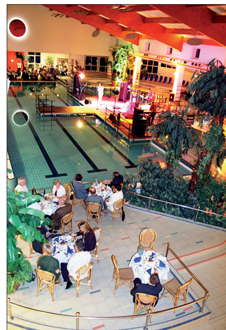
Während der gemeinsamen Geburtstagsparty in der Kirschauer Körse-Therme

Das Kirschauer Freizeit- und Gesundheitsbad hat nahezu jeden Tag im Jahr geöffnet. Ausnahmen sind der 24., 25. und 31. Dezember sowie eine wartungsbedingte Ruhedekade für die Besucher im Juni. Die detaillierten Öffnungszeiten und Eintrittspreise gibt es im Internet unter www.koerse-therme.de .