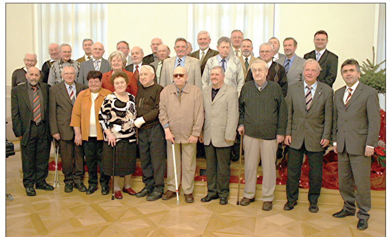
Das Gruppenfoto gehört zum jährlichen Treffen, wie der Stollen zur Weihnachtszeit

Schüler der Kreismusikschule Bautzen umrahmten den Nachmittag mit ihrem Können.