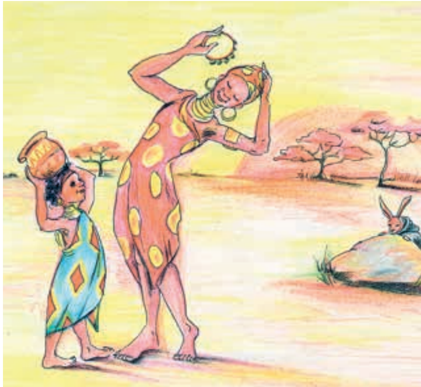
Ein Stück über die Lust am Leben, über eine heikle Sache und afrikanische Lebensart feiert am 19. Februar Premiere.