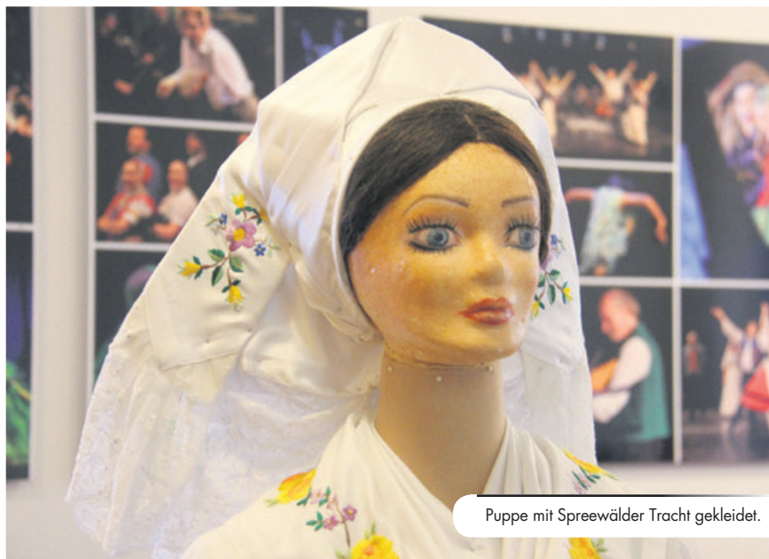
Puppe mit Spreewälder Tracht gekleidet.

ten Spreewälder Trachten werden vom Sorbischen Nationalensemble , das über eine reichen Fundus verfügt, freundlicherweise zur Verfügung gestellt.