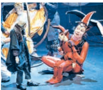
Die Geschichte beginnt mit einer Wette. Das Versuchsobjekt heißt Faust und der Wetteinsatz ist dessen Seele. Faust jagt durch sein Leben und sucht nach etwas, das er nur in sich selbst finden kann.

Einmal in jeder Spielzeit zeigen wir 14 Tage lang im Februar für Schüler und Erwachsene unsere Faust-Variante, die nicht wie üblich am Ende von Teil 1 mit der tragischen Kerkerzene von Gretchen endet, sondern den nach seinem Glück suchenden Faust auch durch den zweiten Teil bis zu seinem Ende begleitet. Es ist ein kurzweiliger Streifzug. Im Original hat Goethes