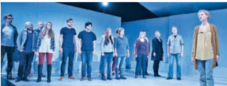
Hin- und hergerissen zwischen Menschenfreundlichkeit und Furcht vor dem Anderen, zwischen dem Reiz des Exotischen und tief sitzenden Vorurteilen, zwischen Neugier und Angst, geraten die Helden an den Rand ihrer Existenz.

Wenn das Fremde vor der Tür steht, gerät die Welt des durchschnittlichen Wohlstandsbürgers aus den Fugen – mit Folgen: »Wir sind keine Barbaren« am 2., 3. und 10. Februar, jeweils 19.30 Uhr im großen Haus.