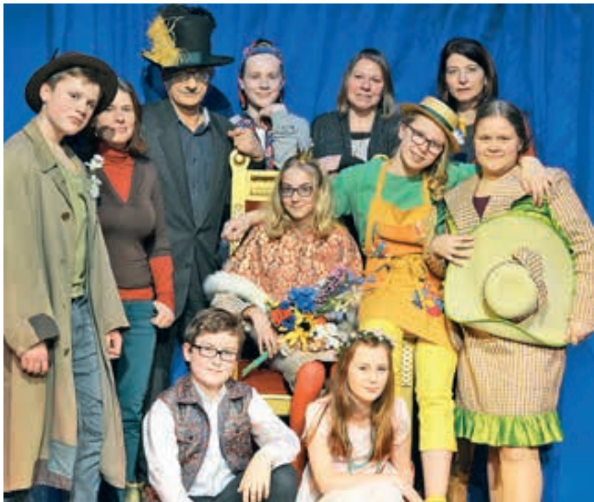
Hrajerki a hrajerjo Serbskeho džěćaceho džiwadła ze swojey režiserku, dramaturgom, wuhotowarku a džiwadlowej pedagogowku.