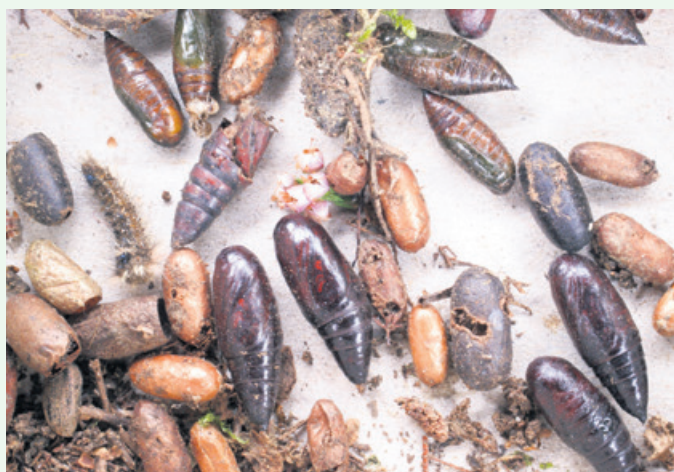
Ergebnis der Winterbodensuche: Schachtel mit verschiedenen Raupen und Puppen

Ein Bericht zum Waldschutz 2016, der auch Schäden durch Waldbrände und Hagel enthält, ist unter http://www.landkreis-bautzen.de/67.html zu finden.