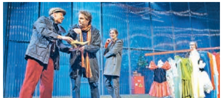
Es gibt Momente, in denen man nicht recht glauben will, dass aus den Paketboten in ihrer Arbeitskluft anmutige Künstler in Frauenfummeln werden. Sie werden! Wunderbar!

Vorstellung mit kostenloser Kinderbetreuung