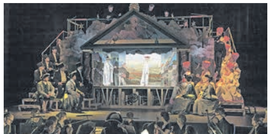
Die Inszenierung ist eine Koproduktion mit den Landesbühnen Sachsen, Radebeul.

beiden alten Leute Philemon und Baucis, die bei einem Unwetter, welches die Götter auf die Erde schickten, ihre geliebten Kinder verloren haben. Nachdem aber Jupiter und Merkur als Pilger verkleidet die Tugend, Herzlichkeit und Gastfreundschaft des alten Paares erfahren durften, endet alles gut: Der gerührte Göttervater macht Aret und Narcissa wieder lebendig.