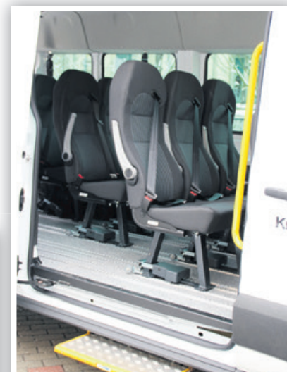
Werden mehr Plätze für Rollstühle benötigt, lassen sich die Sitzplätze beliebig entnehmen.

mit Handicap dann besonders zu kämpfen hat.“ Selbstverständlich wird der Kleinbus auch für andere Fahrten im Rahmen aller satzungsgemäßen Einsätze unterwegs sein. Fahrdienste, Kindertagesstätten, Sozialstationen, Pflegeheim, Rettungsdienst, Behindertenhilfe, Schwangeren- und Familienberatung ... die Aufzählung der Einsatzgebiete