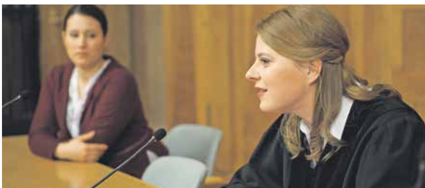
Ferdinand von Schirach stellt in seinem ersten Theaterstück die Frage nach der Würde des Menschen. Die Schöffen, also Sie, liebes Publikum, haben zu entscheiden.

Vorstellung am 9. Januar, 19.30 Uhr im Landgericht, Lessingstraße in Bautzen