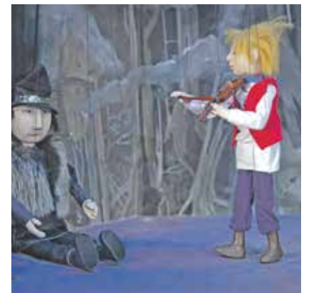
Ein Stück, das sein Publikum in die abenteuerliche Lausitzer Sagenwelt entführt und von der bezwingenden Kraft und Schönheit der Musik erzählt.