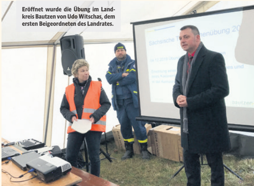
Eröffnet wurde die Übung im Landkreis Bautzen von Udo Witschas, dem ersten Beigeordneten des Landrates.