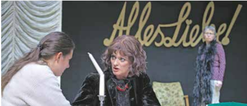
Der schwedische Autor Jonas Gardell ist bekannt für seinen kritischen Blick auf alltägliche Situationen und sein Talent, sie durch präzise Charakterdarstellungen humorvoll zu karikieren.

Die Mutter hofft nun auf ihren Sohn Gabriel, ein bekannter Schriftsteller, der nicht zum Geburtstag erschienen ist, weil er parallel zum Fest ein TV-Interview zu seinem neuen Buch gibt. Trotz Streit fiebern die drei Frauen der Sendung mit Spannung entgegen. Doch noch einmal nimmt der Abend eine plötzliche Wendung und die Feier gerät vollends außer Kontrolle. Ein bitterböses, komisches Stück über die Abhängigkeiten und Abgründe in einer normalen Familie.