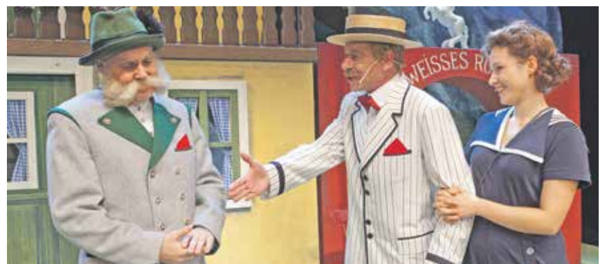
Wunderbare Melodien am laufenden Meter, Urkomisches und eine kleine Prise Sentimentalität. Wie sagt Kaiser Franz-Joseph doch zum Schluss? »Es war sehr schön, es hat mich sehr gefreut!«