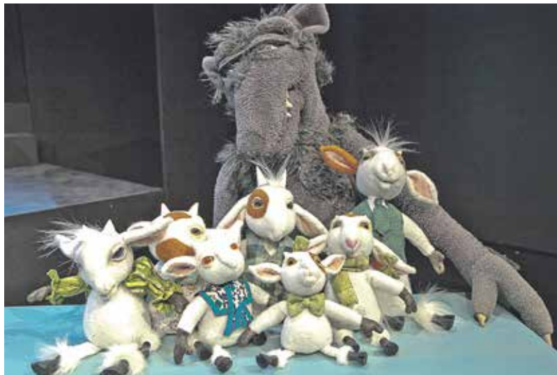
Wie schon beim Rotkäppchen werden an diesem Puppentheaterstück nicht nur die Kleinen ihre Freude haben, auch die erwachsenen ZuschauerInnen haben hier viel zu lachen.

K aum einer ist in der Oberlausitz so aktiv und medienpräsent wie der (böse) Wolf – Serientäter. Ganz frisch hereingekommen ist nun eine Vermisstenanzeige der Geiß: 6 kleine Ziegen sind nicht mehr auffindbar. Die ursprüngliche Zahl von 7 Geißlein ist inzwischen korrigiert worden, das kleinste fand sich wieder ein. Dringend tatverdächtig und somit zur Fahndung ausgeschrieben ist Wölfchen. Bereits 2012 verplapperte dieser sich in der Premiere von »Rotkäppchen«, dass er Kreide gefressen hat, damit die Geißlein seine Stimme nicht erkennen. 7 Jahre später proben wir nun also endlich die »7 Geißlein« als Vorgeschichte. Zuvor musste natürlich eine wichtige Frage geklärt werden: Wie überlebt der Wolf den Sturz in den Brunnen, wenn er daraufhin zum Mädchen mit der roten Mütze gelangt? Die Antwort darauf ist in unserer »Hans im Glück«-Fassung zu erleben. Es entsteht also ein ganzes Märchenuniversum um unseren Wolf herum. Auch das Rotkäppchen hat einen kleinen Gastauftritt in der neuen Produktion. Erzähler ist Jäger Herbert – der, der im Rotkäppchen nie auftaucht. Jetzt wissen wir auch, warum, denn er ist gebeten worden, woanders etwas über den Wald zu erzählen und über die Regeln, die im Wald dringend eingehalten werden müssen. Darüber hinaus zieht er die Parallele zu Familie Geiß, die nämlich zu Hause auch zwei Regeln streng befolgt: Wenn die Mutter