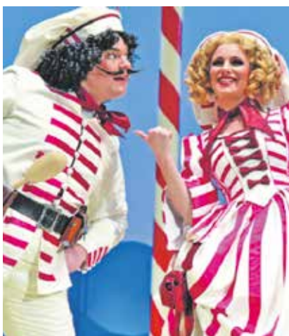
»Alle maskiert, alle maskiert, wo Spaß, wo Tollheit und Lust regiert.« Einmal im Jahr feiern die Venezianer ausgelassen den Karneval.

Am 17. Januar, 19.30 Uhr feiert die Inszenierung »Eine Nacht in Venedig« des Gerhart-Hauptmann Theaters Görlitz-Zittau Premiere im großen Haus (weitere Vorstellungen am 18. und 24. Januar ). Im Karneval scheinen alle gesellschaftlichen Konventionen außer Kraft gesetzt.