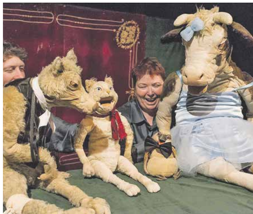
An drei Abenden in Folge wird es ein Wiedersehen mit den »Berliner Stadtmusikanten« geben. Ein tierischer Erlebnis-, Augen- und Ohrenschmaus!

musikanten II« und am 19. Januar folgt – Sie werden es erraten – um 19.30 Uhr im Burgtheater »Vier Millionäre – die Berliner Stadtmusikanten III«. Die volle Dröhnung Comedy im Puppentheater. Aber keine Sorge, auch wenn Sie nicht 3 Abende hintereinander mit Kerzen und einem Glas Wein im Theater verbringen wollen, die Stücke funktionieren auch alle allein stehend für sich. Die Besonderheit bei der Wagnerschen Version der »Bremer Stadtmusikanten«, es handelt sich nicht um Esel, Hund, Katze und Hahn, sondern um Frau Kuh, Herrn Wolf, Frau Katze und Herrn Spatz, die im Altersheim leben aber trotzdem noch einmal etwas erleben wollen. Ob sie je die erträumte Zielstadt Berlin erreichen bleibt ob der vielen Episoden zu bezweifeln. In Teil 2 werden die 4 Helden in einen großen Kunstraub verstrickt und im dritten Abenteuer wird eine Intrige um die inzwischen zu Millionären gewordenen Tiere gesponnen. All das mit einer Menge Charme, Unerwartetem und viel Musik.